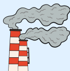
Contaminación del aire

Es crucial que las personas con asma mantengan un ambiente limpio tras el lavado de sábanas, la revisión de pestes y el uso de filtros de aire en el hogar.